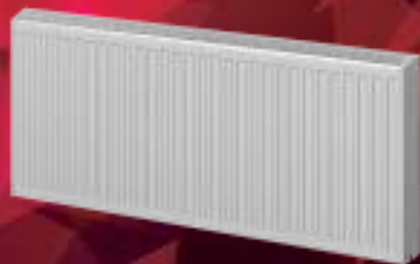
ТИП 11 – 1 панель + 1 конвектор ТИП 21 – 2 панели + 1 конвектор ТИП 22 – 2 панели + 2 конвектора ТИП 33 – 3 панели + 3 конвектора